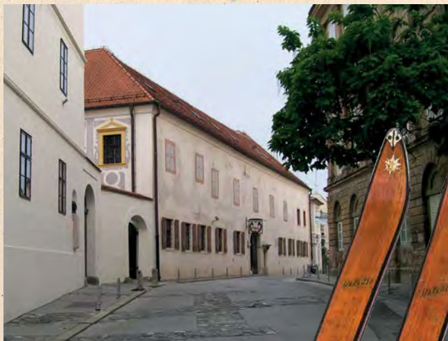
Muzej grada Zagreba

Kako ništa ne može biti jednostavno, na pronađenoj mrežnoj stranici preuzet je samo dio toga broja Liječničkih novina. Već smo se vidjeli u Hrvatskoj liječničkoj komori ili u nekoj od knjižnica u potrazi za tim brojem, ali skloniji liniji manjeg